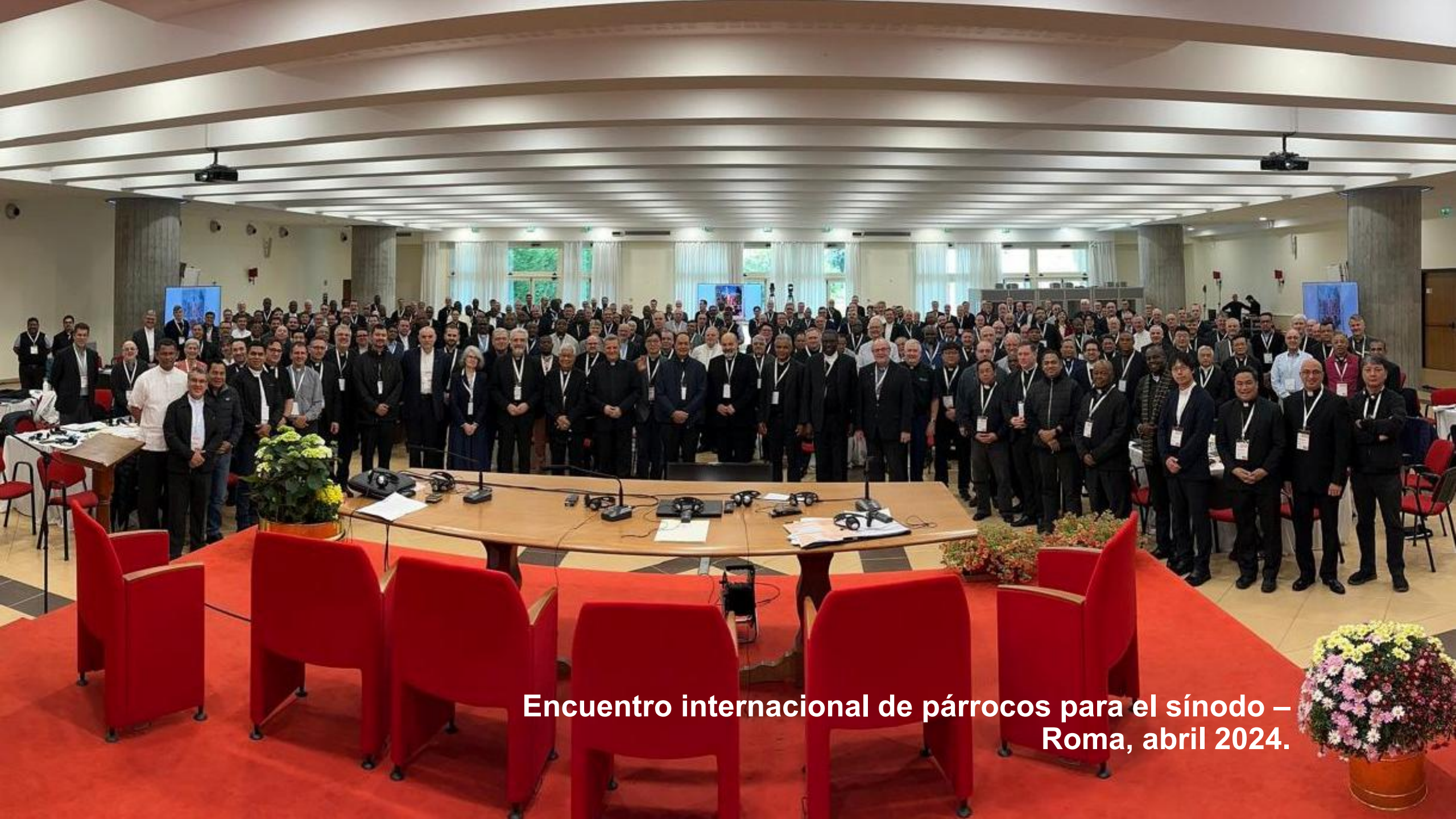
Encuentro internacional de párrocos para el sínodo – Roma, abril 2024.